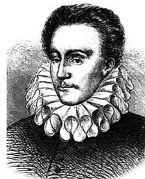
Etienne de la Boétie.

El padre de Montaigne se había mostrado tolerante permitiendo que sus hijos se adscribieran al credo religioso que eligieran.