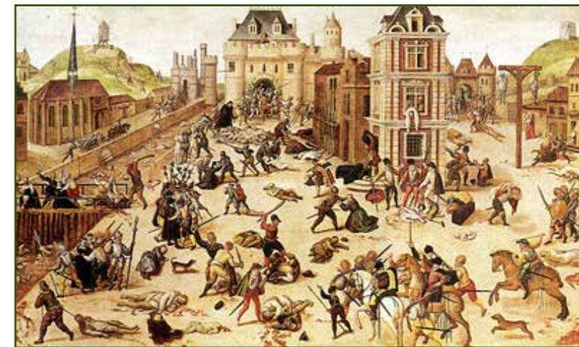
La matanza de San Bartolome.