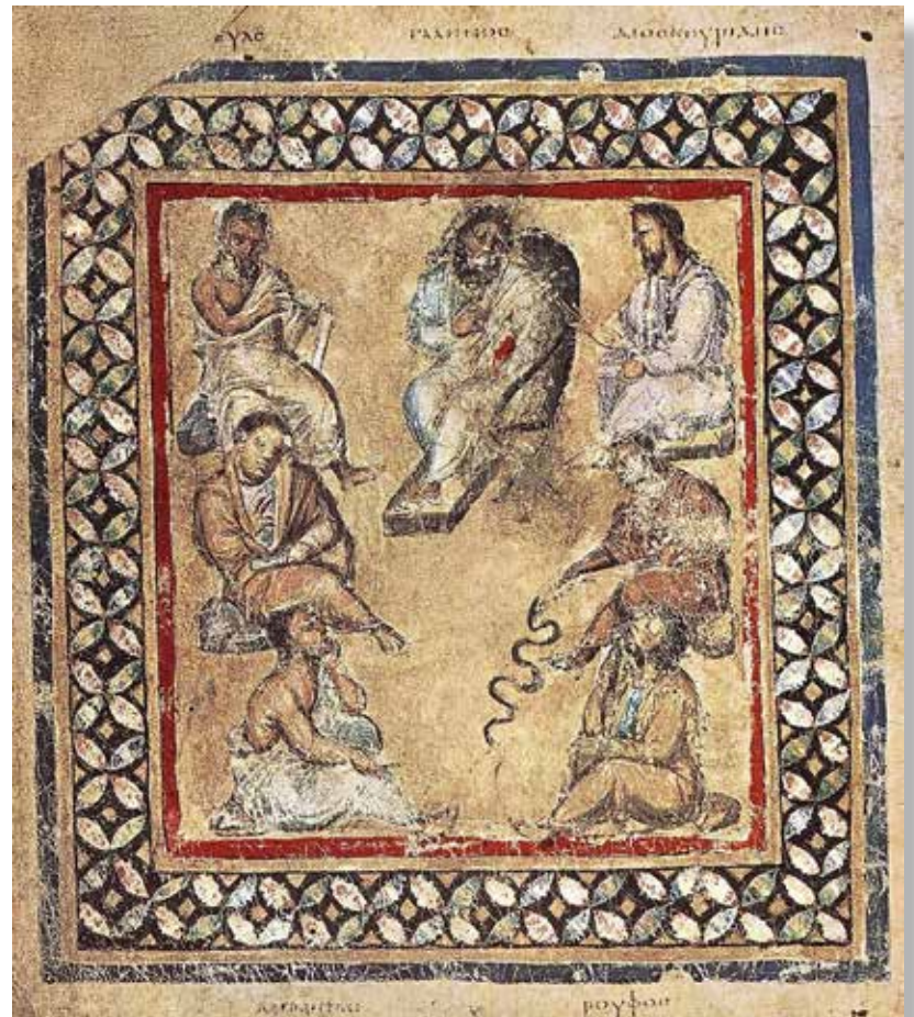
Galeno en Dioscorides.

El hígado, sede del alma concupiscible y vegetativa, se representa por el “ spiritus naturalis ” ( physicon ), que crea la sangre