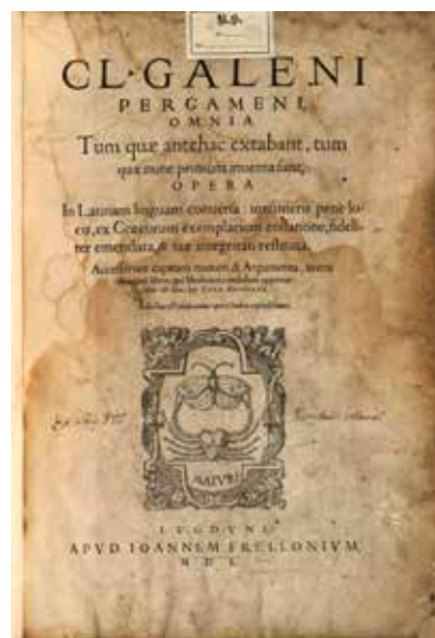
Opera omnia galen servetus frellon.

por transformación directa de los alimentos. De allí, pasa a los pulmones y al corazón donde se satura del “ spiritus vitalis ” ( zoticon ), que es el alma irascible y vital y, por último, se traslada al cerebro donde la espera el alma pensante, sensitiva y racional con el nombre de “ spiritus animalis ” ( psychicon ).