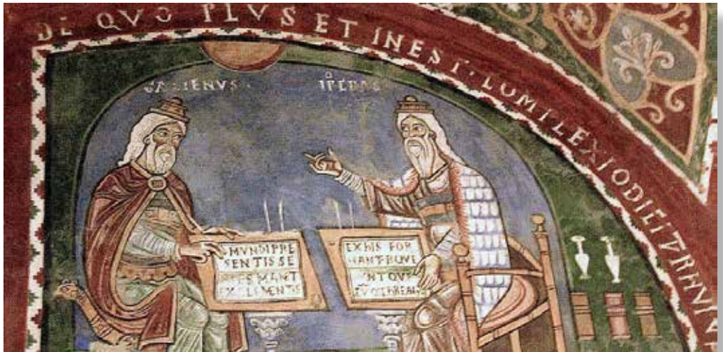
Galeno e Hipócrates.