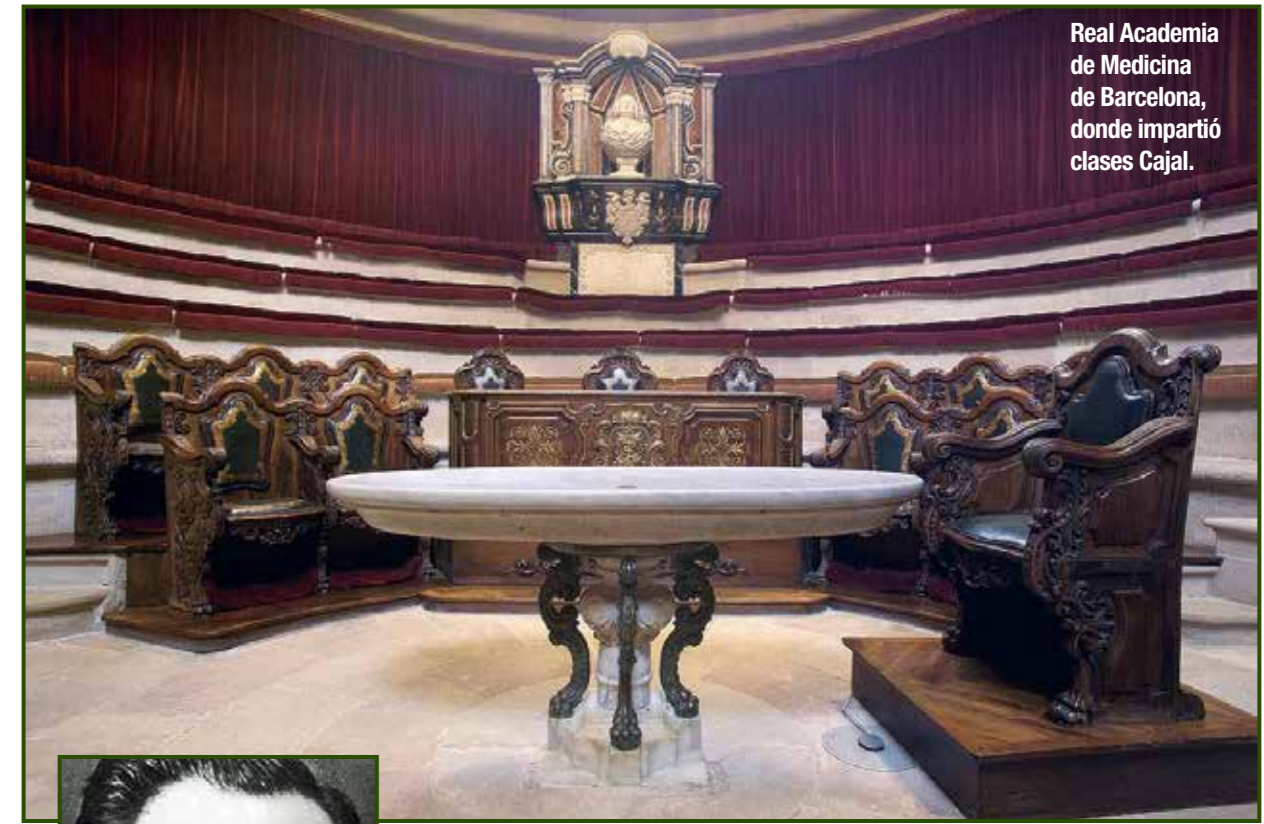
Real Academia de Medicina de Barcelona, donde impartió clases Cajal.