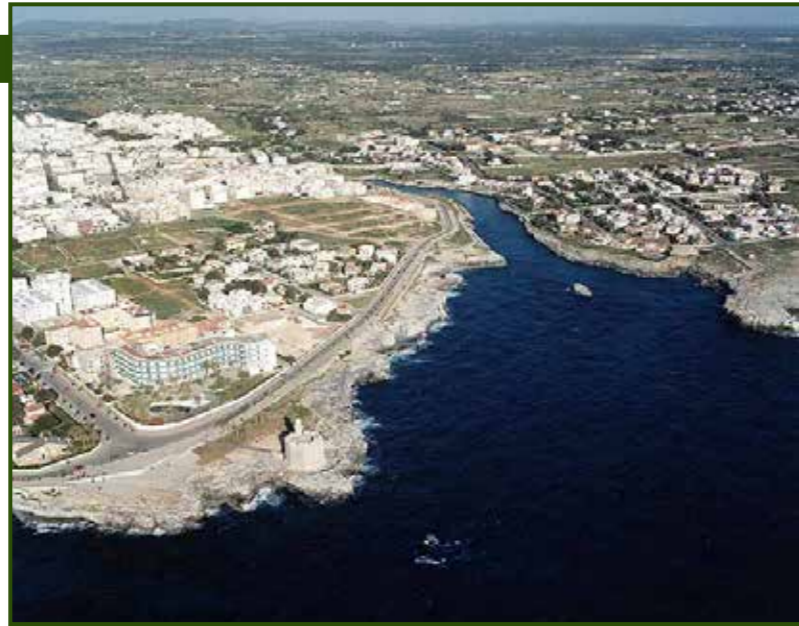
Cala del Degollador.

Jeireddin Barbarroja fue uno de los más conocidos corsarios del si-