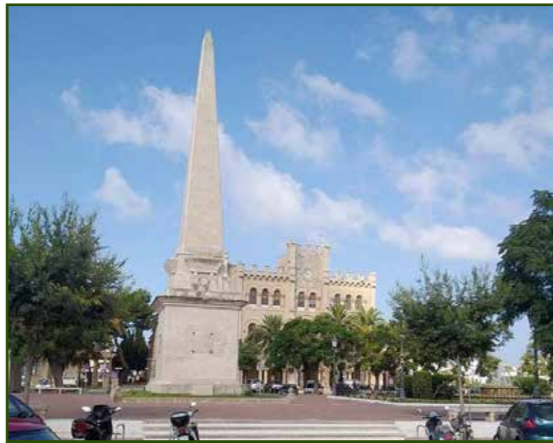
Cala del Degollador.

glo XVI junto con su predecesor y hermano Aruj. Ambos habían creado una sociedad pirata que llevó a los magrebíes, bajo los auspicios de imperio otomano, a alcanzar gran poder sobre el comercio del mediterráneo, basado en el saqueo, el robo, las violaciones y el crimen. Barbarroja se convirtió en una verdadera pesadilla para el imperio español de la época y para buena parte de la Europa cristiana de la