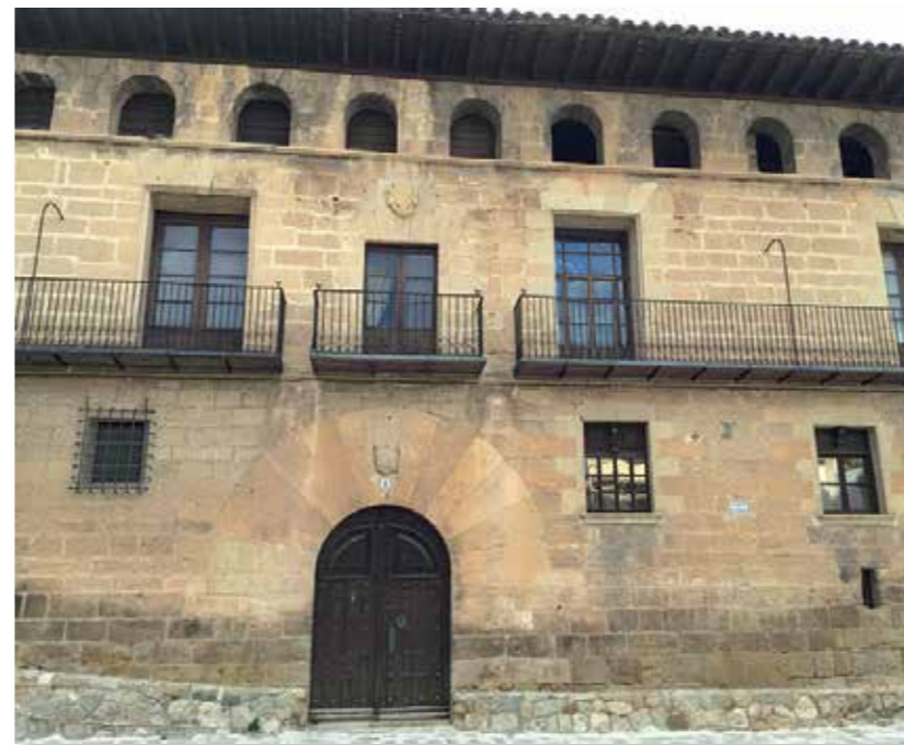
Arriba, plaza típica en Ráfales. A la izq, casa señorial en la Plaza mayor de Fuentespalda. A la dcha, rincón típico en Monroyo.