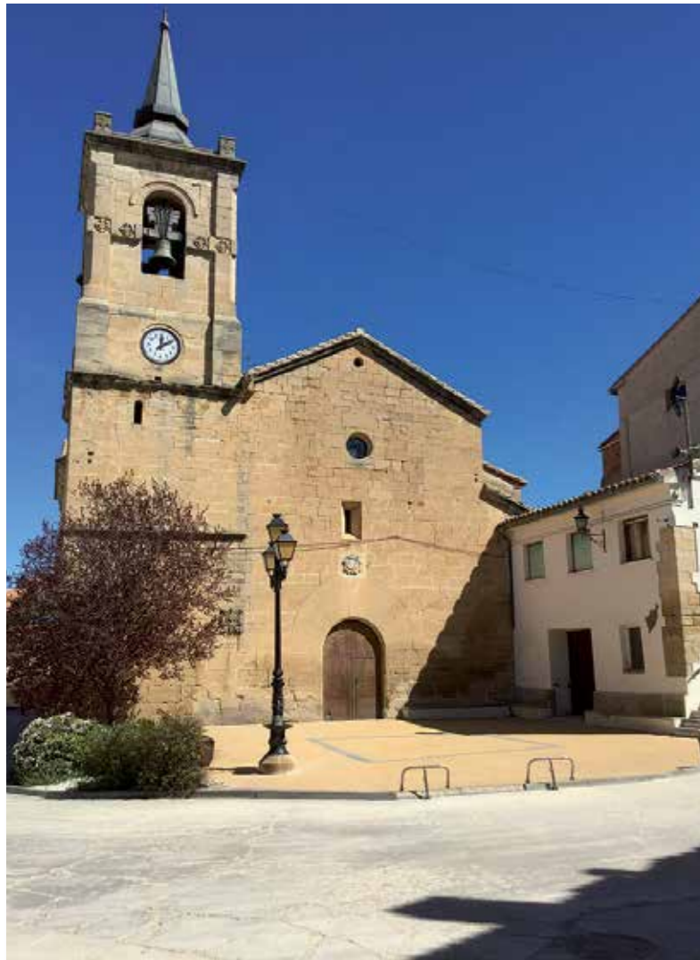
Iglesia de la Portellada.