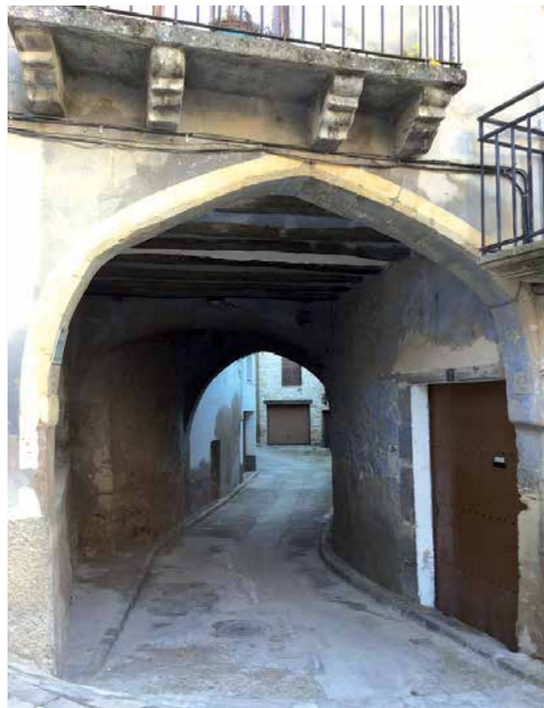
Calle empedrada de Monroyo.