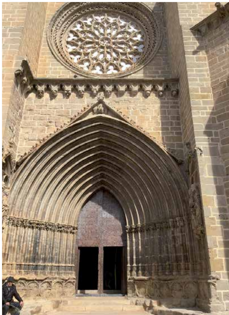
Portico de entrada a la iglesia parroquial de Valderrobres.

San Roque, a mediados de agosto, se canta bajo la hornacina que el santo tiene en una calle del pueblo. Se reúnen las mujeres con sillas para sentarse y cantan durante una hora diversas oraciones: la de San Roque, la del Pilar, etc., como acción de gracias al santo por haber desterrado la peste que asoló el lugar a principios de siglo.