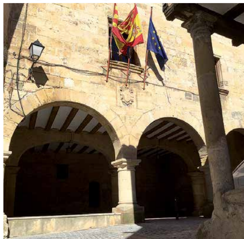
Ayuntamiento de Monroyo.

El edificio que mejor define el perfil de Cretas es, sin duda, su impresionante iglesia manierista dedicada a la asunción de Nuestra señora