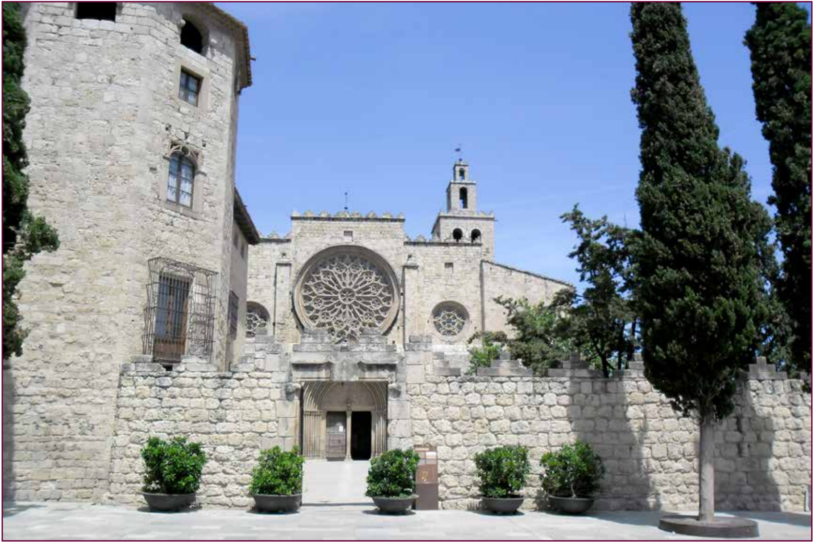
Monasterio románico de Sant Cugat.