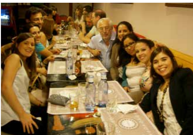
Escuela de Verano, Toledo.