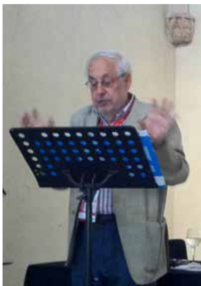
El autor en Sant Cugat.

en las consultas y a la cabecera del enfermo real.