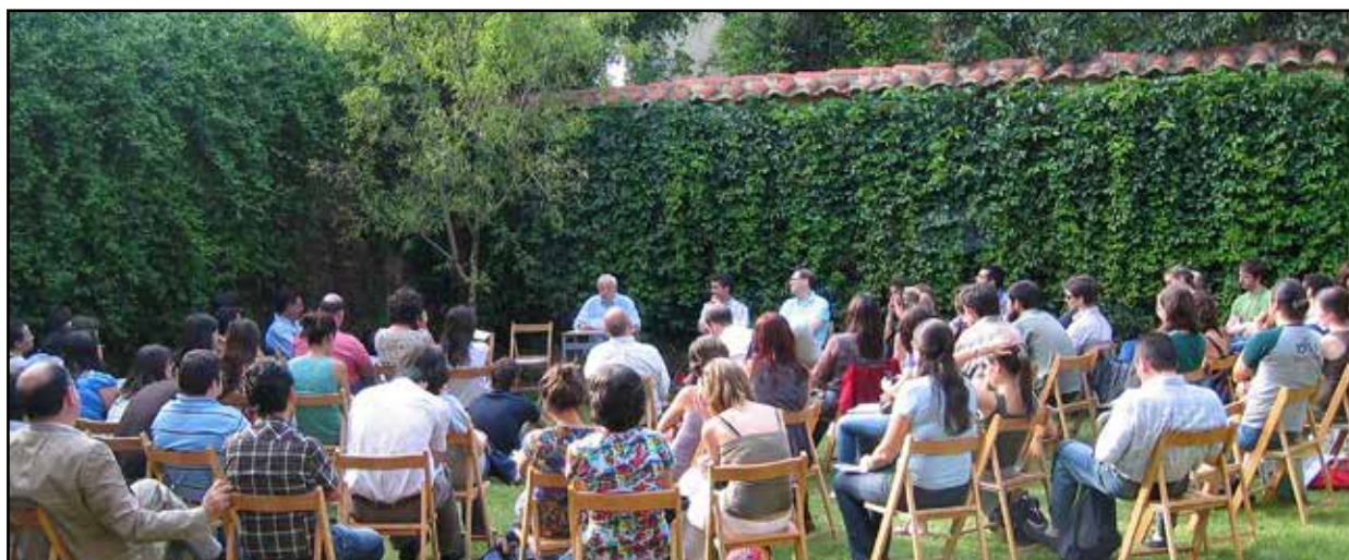
Escuela de Verano, Fundación Sierra-Pambley, León.

Otras obras del Museo del Prado sometidas a la mirada médica del internista fueron: San Jerónimo, de Marinus van Reymerswaele, un modelo clínico de esclerodermia; Carlos II , de Juan Carreño de Miranda, con un probable síndrome de Klinefelter;