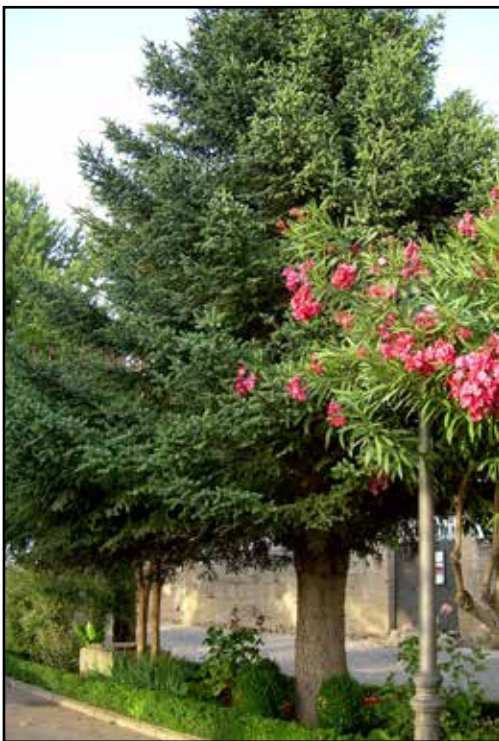
Árbol relíctico Pinsapus, Ronda.

esa habitación. Y, añadió, suba, ahora no hay nadie.