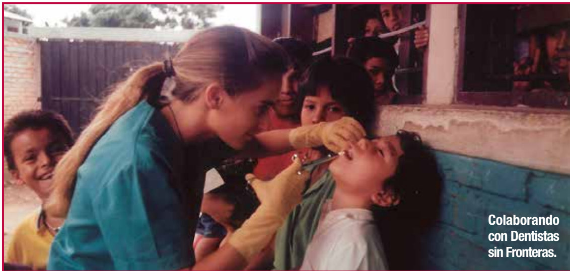
Colaborando con Dentistas sin Fronteras.