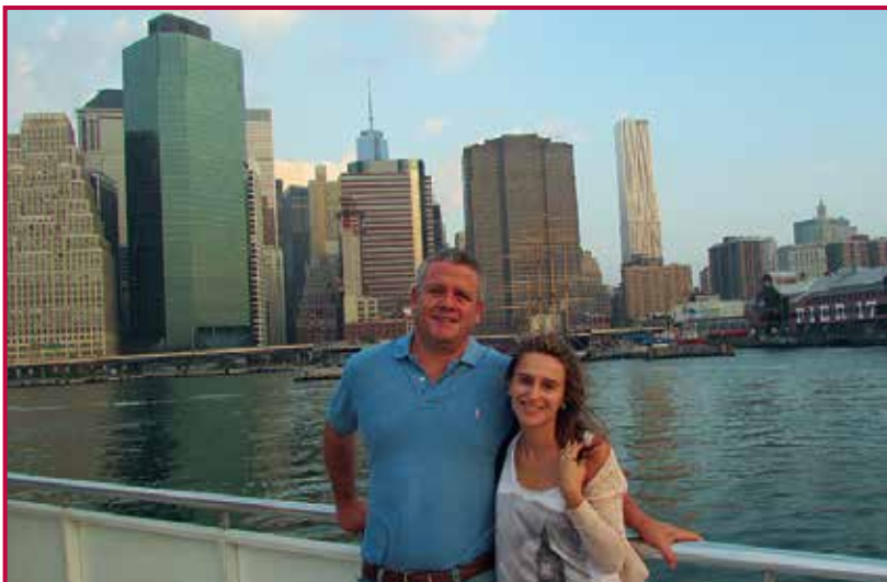
En Nueva York, junto a su marido.