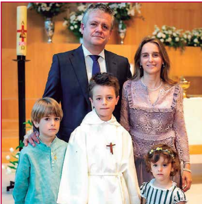
La familia al completo.

destacar que no había agua potable, ¡pero tenían Coca colas!