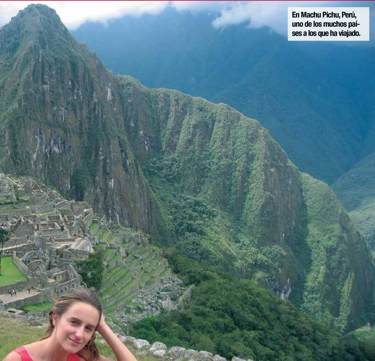
En Machu Pichu, Perú, uno de los muchos países a los que ha viajado.