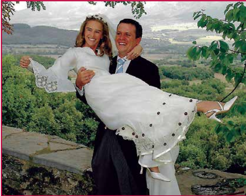
El día de su boda, en el valle de Mena.