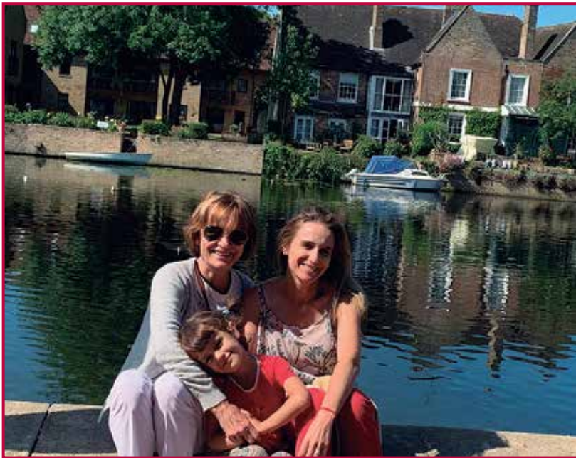
En St. Albans, con su madre e hija.