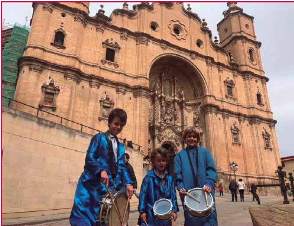
En Alcañiz (Teruel), durante La tamborrada.