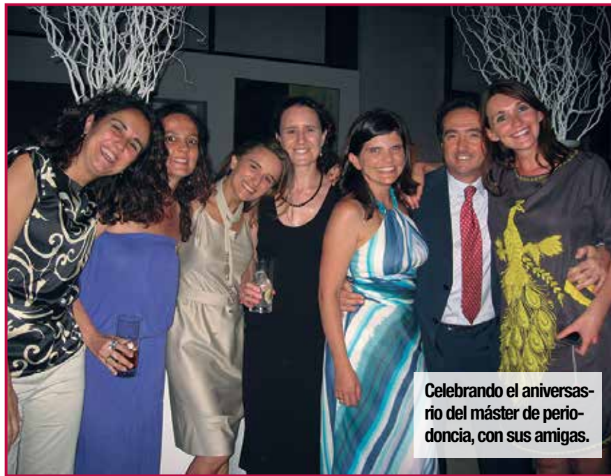
Celebrando el aniversario del máster de periodoncia, con sus amigas.