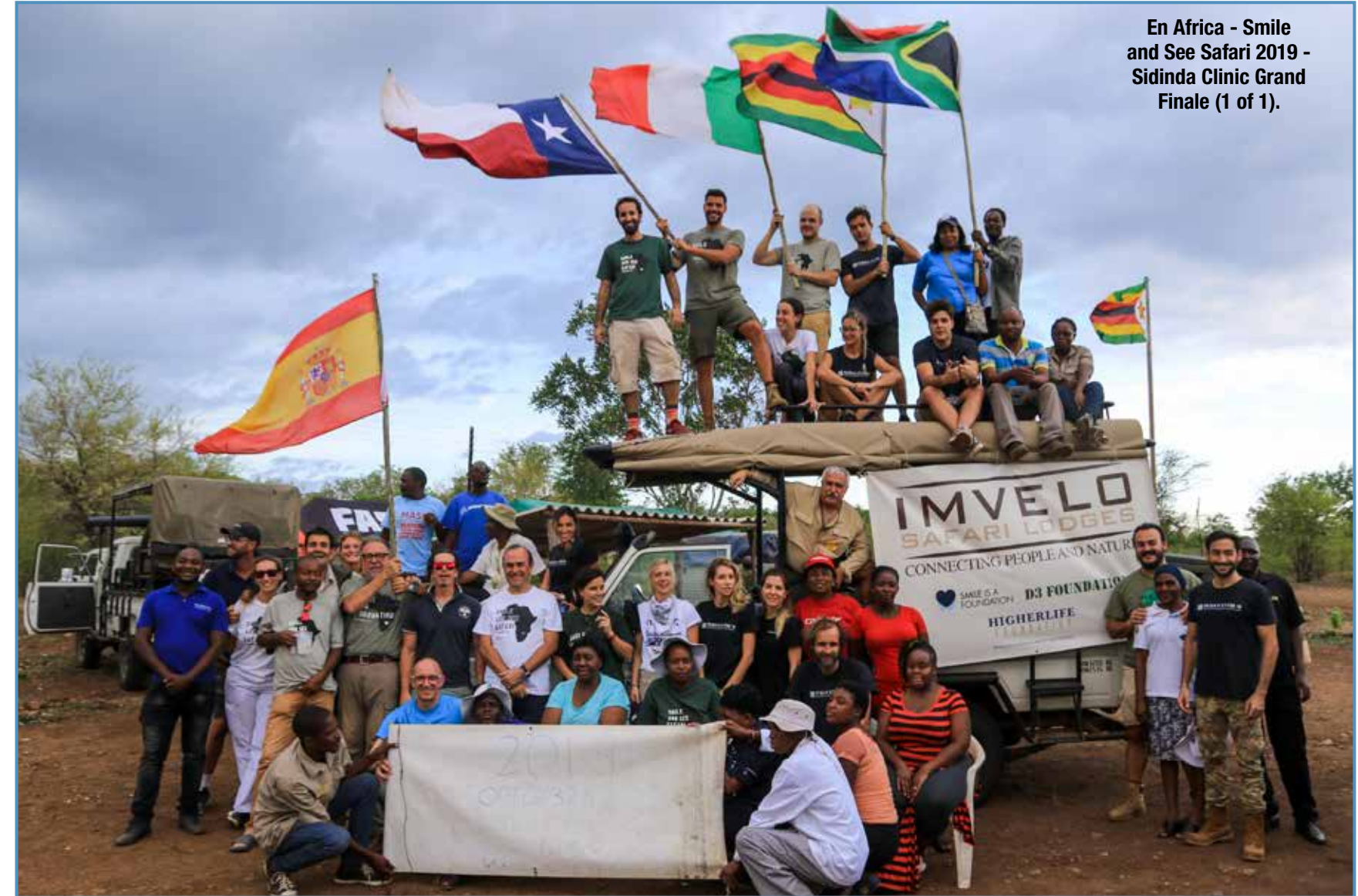
En Africa - Smile and See Safari 2019 - Sidinda Clinic Grand Finale (1 of 1).

Mi actividad docente no solo se limitó a la complutense ya que iba como profesor invitado en el máster de periodoncia e implantes de la Universidad de Sevilla y de la Universidad de Santiago de Compostela. Tenía un curso de formación continua en el Consejo de Dentistas de España intitulado "El manejo de tejidos blandos en dientes e implantes", gracias a este curso tuve la suerte de visitar muchos colegios de toda España. Fue una experiencia personal muy enriquecedora porque me permitió conocer colegas