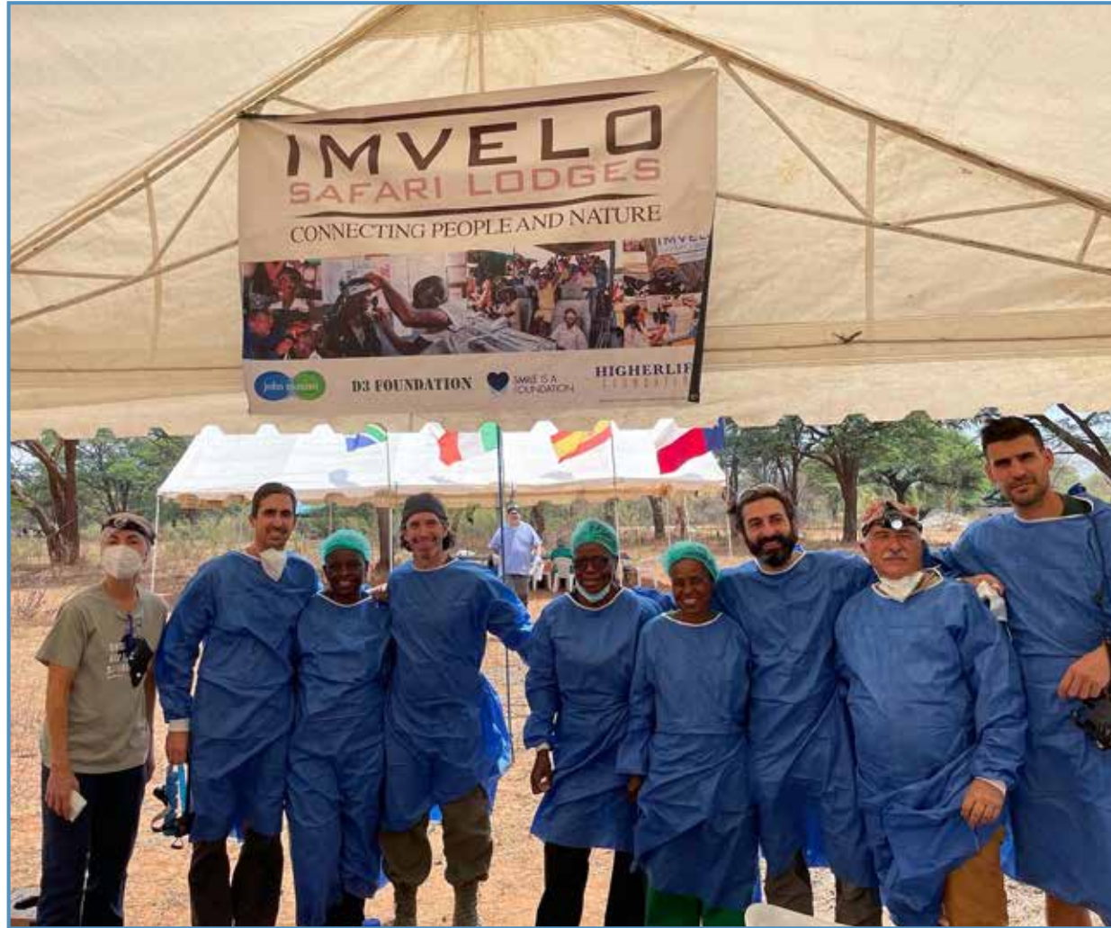
En África con parte del "team".