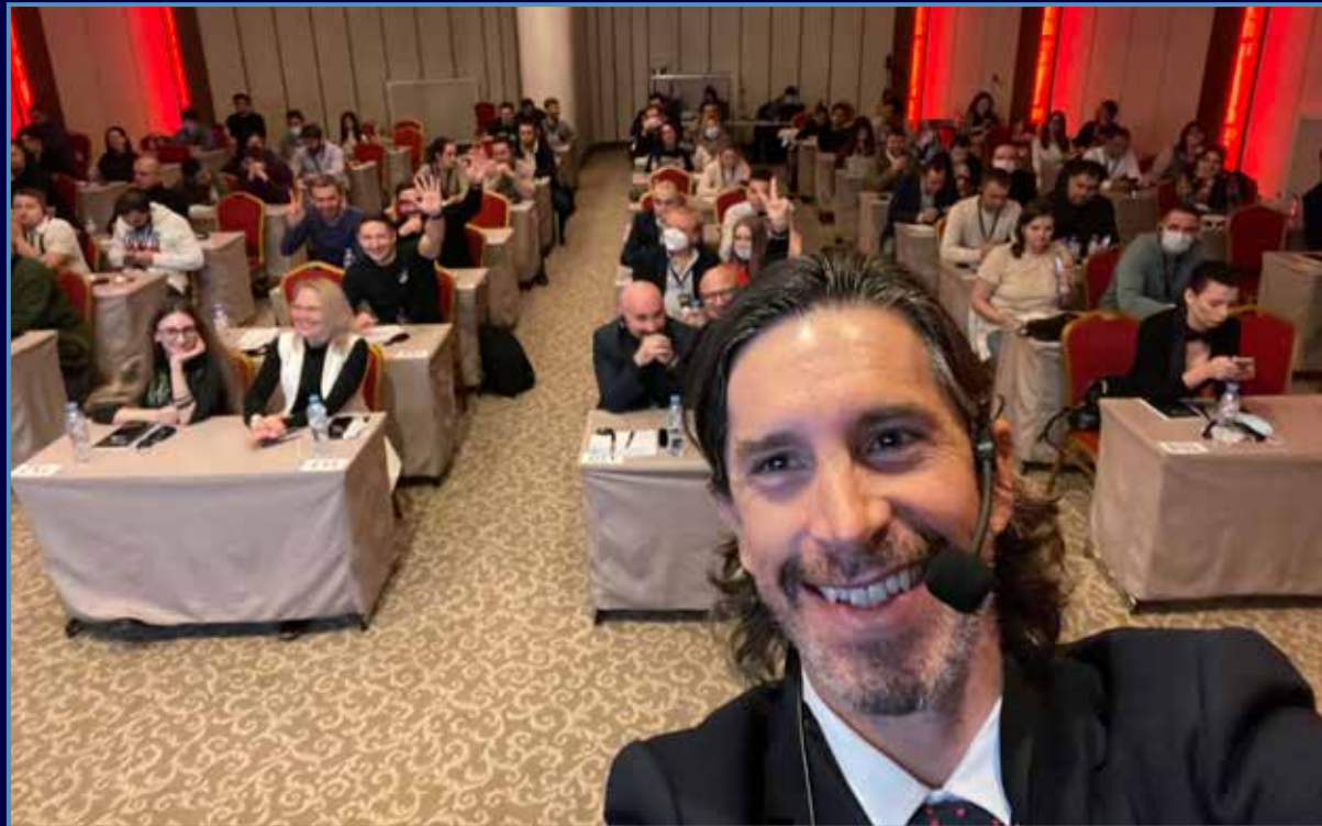
Antes de la ponencia en Moscú todos encerrados en el hotel (2021).