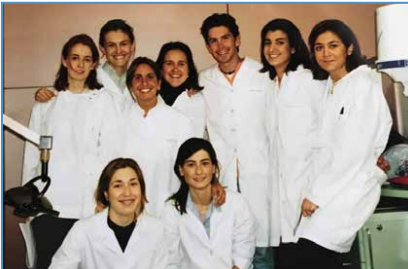
Mis compañeras de clase durante el erasmus 1998.