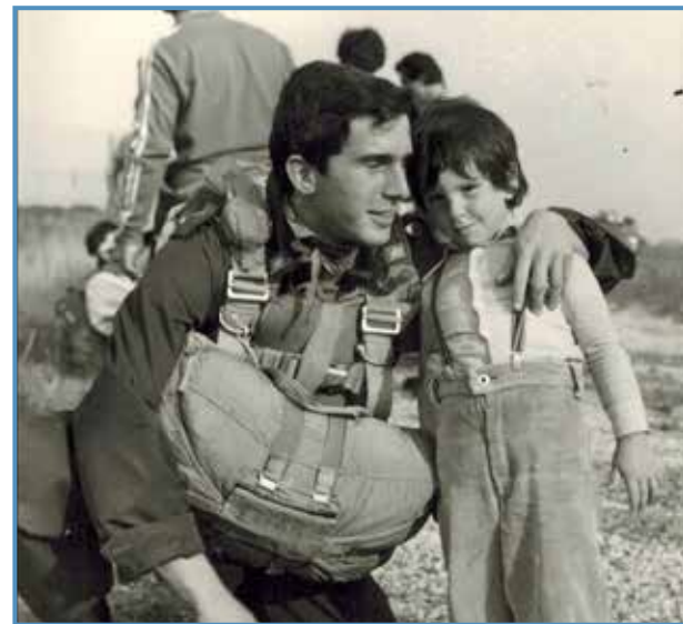
De niño junto a mi hermano mayor.

Durante mi etapa infantil no fui un buen alumno. Era un niño bastante travieso y con bastantes pocas ganas de estudiar. Por esa razón, cuando llegó el bachillerato, mis padres tenían serias dudas de que fuera a llegar a la Universidad, así que decidieron