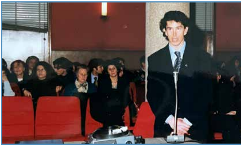
El día de la graduación en Milán (1999).