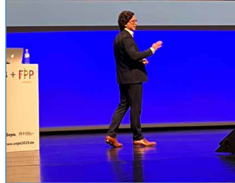
Durante mi primera ponencia en SEPA.

ñola que ha muerto en Ucrania mientras trataba de ayudar a la gente enferma cerca de la zona de conflicto.