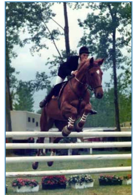
Competición de salto en1987.

Soñaba con tener un caballo de mayor y creo que ese amor por la equitación me sirvió también de estímulo y me ayudó a pasar de ser un niño travieso a un joven con ganas de estudiar y de progresar