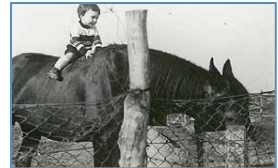
De niño la primera vez encima de un caballo.

entonces les di, aunque a lo mejor hoy las colocaría en un orden diferente—: en primer lugar, el amor. Tenía 24 años, nunca había estado enamorado y en Nicaragua conocí a una chica vasca que formaba parte del grupo de trabajo de la que me enamoré. En segundo lugar, la odontología que, quizás, no fuera tan mala profesión al fin y al cabo. Y, finalmente, a los españoles, que son unas per-