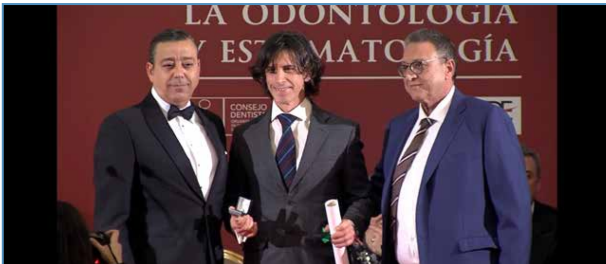
Entrega del premio como dictante de honor en Madrid (2018).