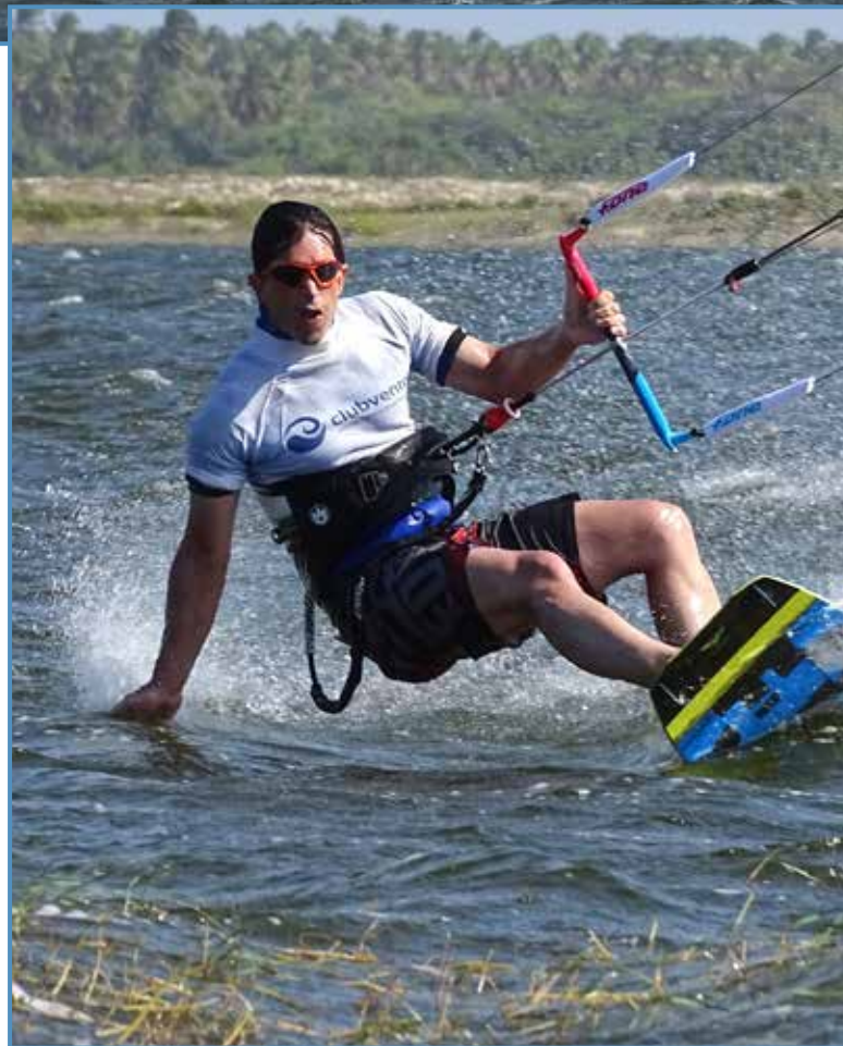
Practicando el kite surf en Brasil.

R.- He sido una persona muy deportista a lo largo de toda mi vida, de chaval sin duda fueron el esquí y la equitación lo que ocupaban mi tiempo libre, luego por cambios de la vida ya que yo viva al lado de las dolomitas y me fui a vivir a España el esquí lo deje. La equitación implicaba demasiado tiempo, era difícil combinarlo con el trabajo así que motivado por mis amigos y colegas empecé la práctica del kite surf. Creo que en general el deporte es fundamental, te ayuda a llegar a mis 49 años físicamente en forma, pero al hacerse uno mayor necesita te-