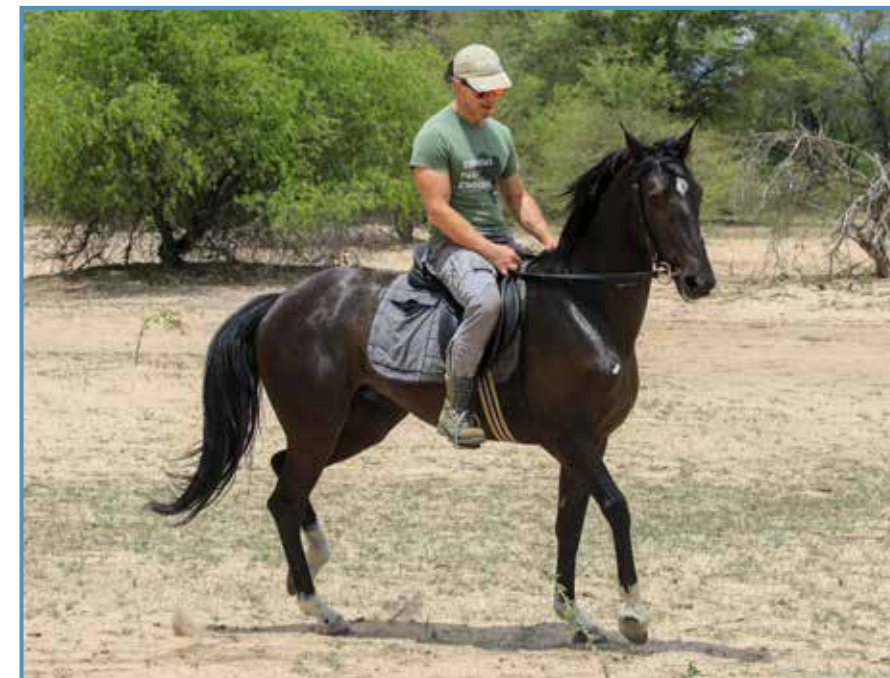
En África volviendo de la escuela de Ngamo.