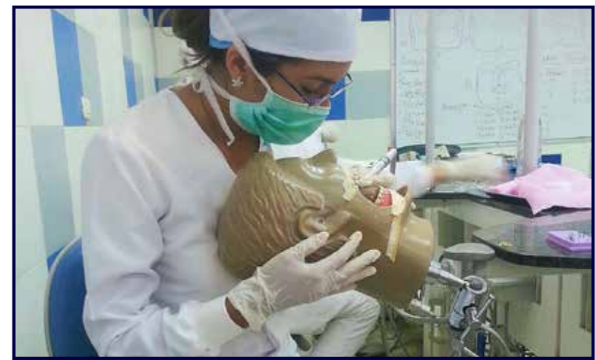
Práctica peclínica Universidad José Antonio Páez - Venezuela.