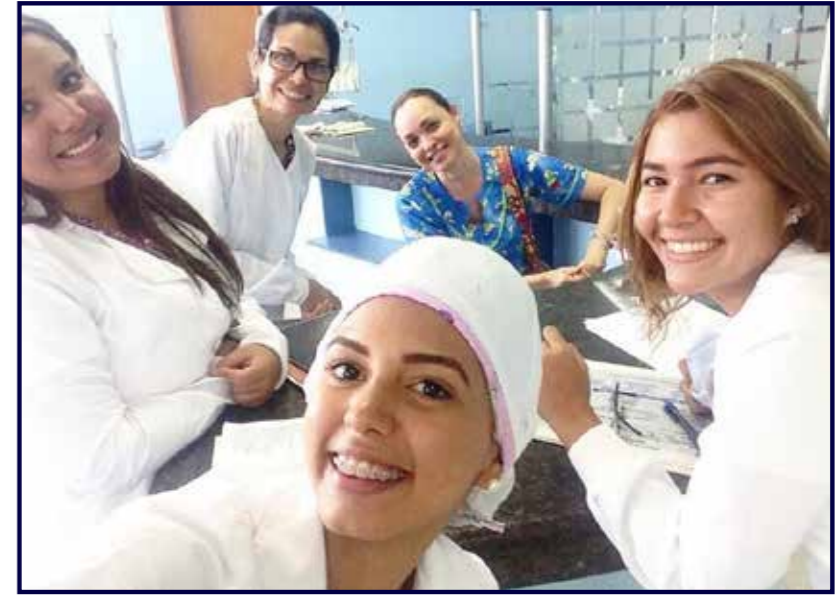
Presentación de mi primer caso clínico.

R.- De pronto llegó a mis manos números de agencias reclutadoras de dentistas para trabajar en el extranjero lo que conllevó a tener aún más curiosidad. Mo-