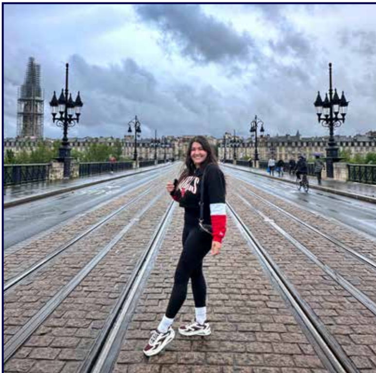
En Bordeaux, la "cite du vin" 2022.

sío, y estoy emocionada porque se presente la oportunidad de hacerlo realidad.