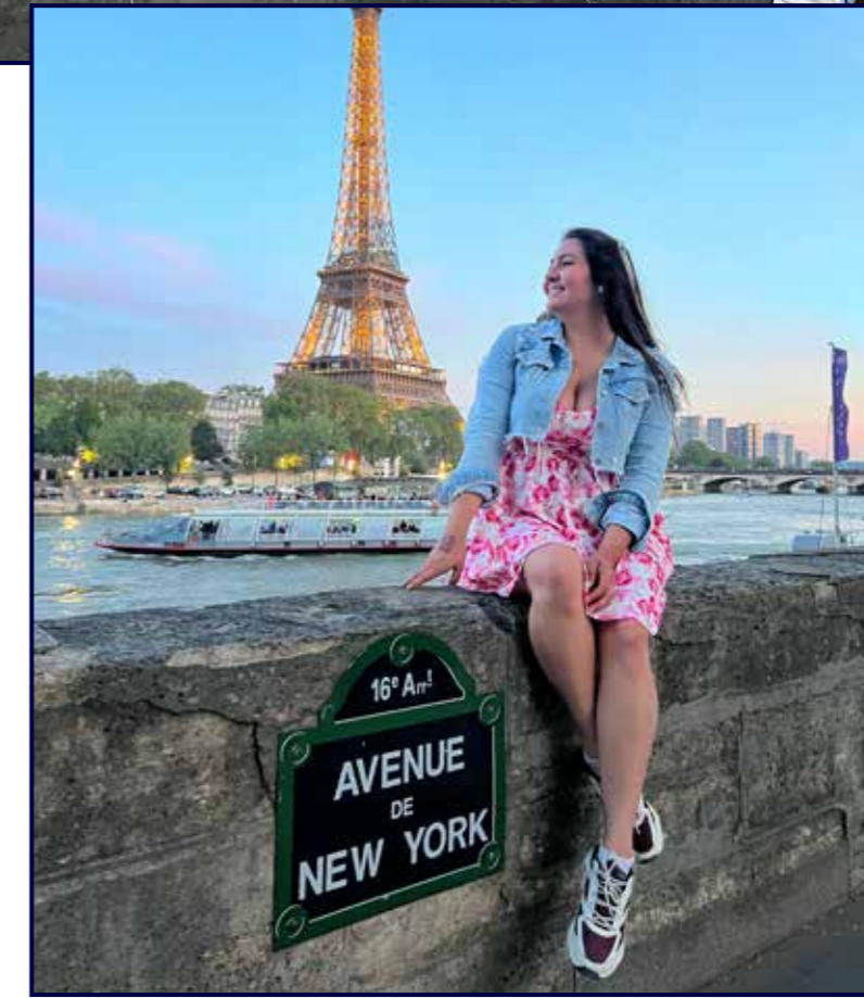
Celebrando su primer año en Francia.

R.- Enfrentar las dificultades que conlleva estar lejos de casa y convertir el lugar que estoy en un hogar ha sido el mayor de mis desafíos, haber tomado la decisión de dejar Venezuela para es-