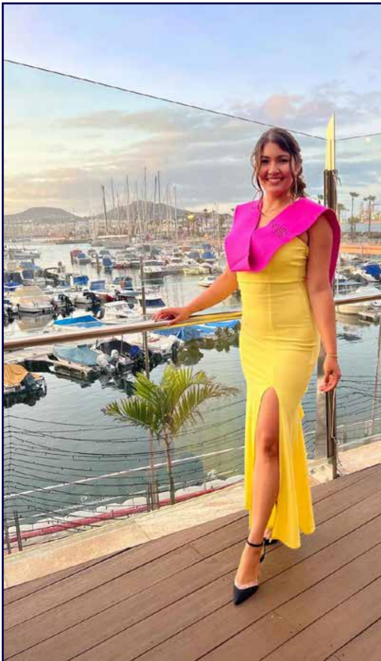
Día de la graduación en Odontología Universidad Fernando Passoa, Canarias 2022.