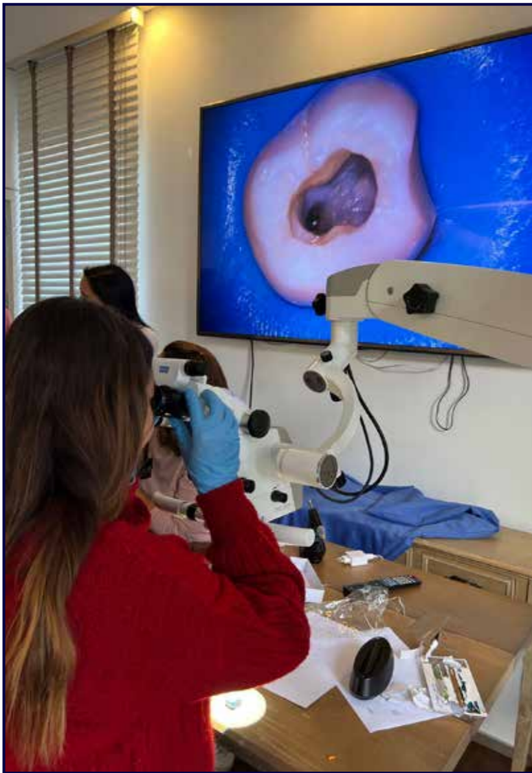
Curso de endodoncia avanzada Granada 2022.