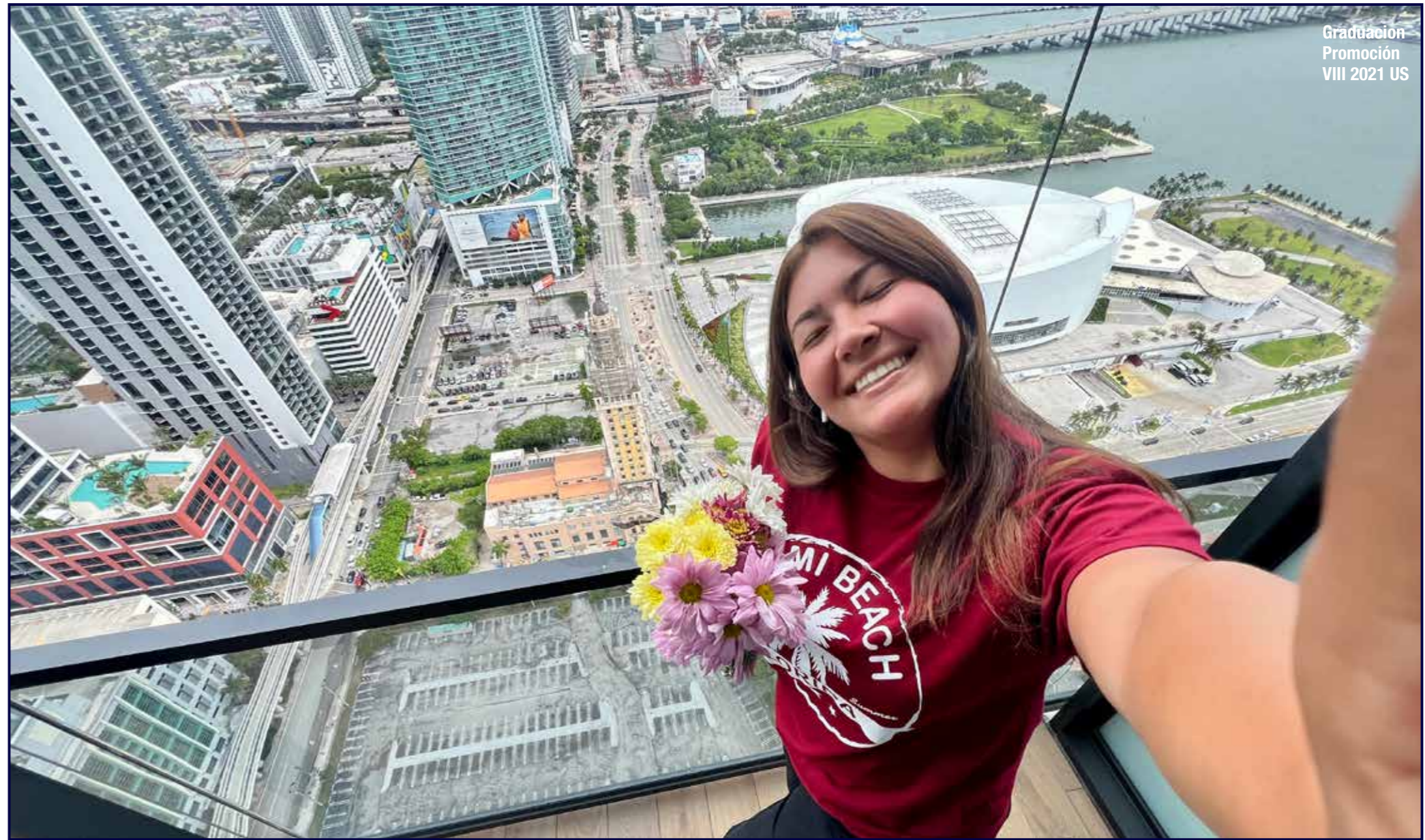
Graduación Promoción VIII 2021 US

R.- ¡Persigan sus sueños sin dudarlos y aprovechen cada momento!. Hay una frase que realmente resuena conmigo: la suerte llega cuando la preparación se encuentra con la oportunidad, como decía Séneca. Pienso que cada experiencia puede abrir puertas a nuevas oportunidades en su carrera junto con un crecimiento personal invaluable.