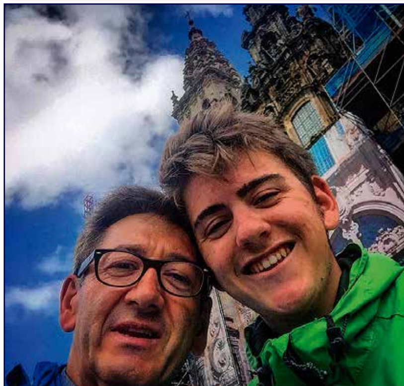
Recuerdos de su llegada a la Catedral de Santiago.