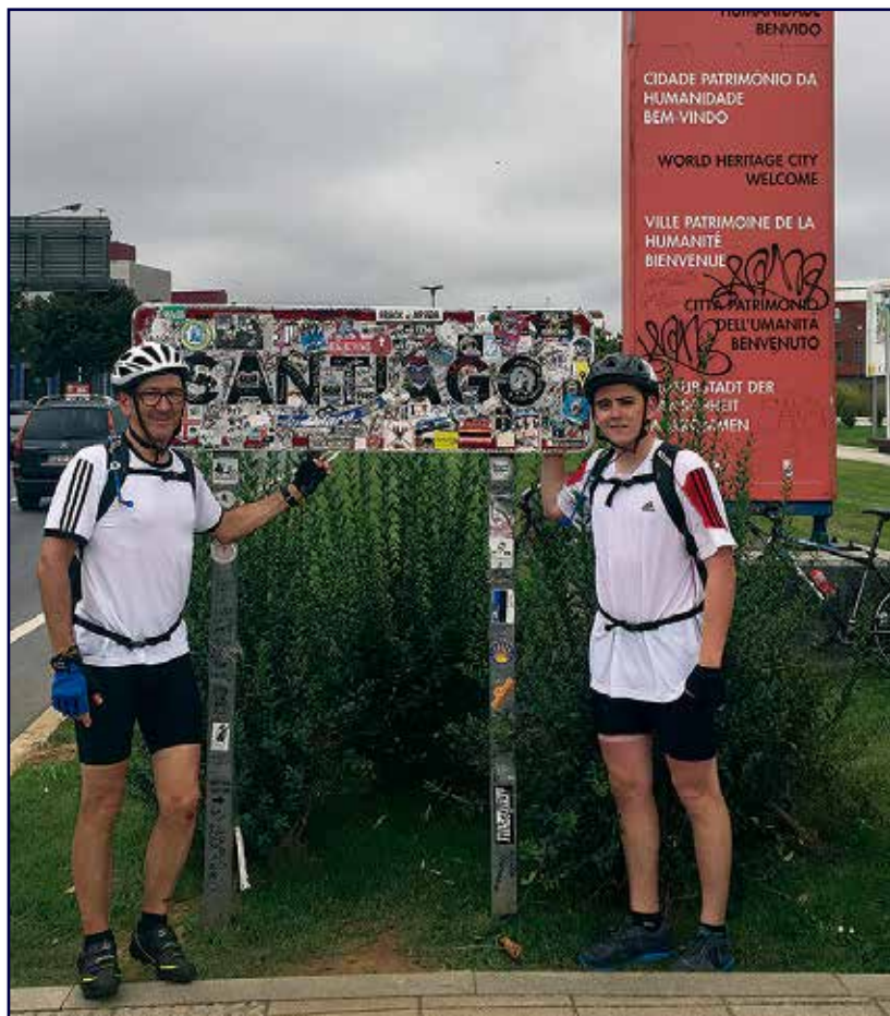
Entrada en la ciudad de Santiago.