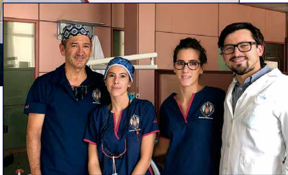
Un martes de prácticas en el Máster de Periodoncia en Madrid.