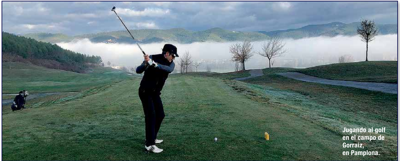
Jugando al golf en el campo de Gorraiz, en Pamplona.