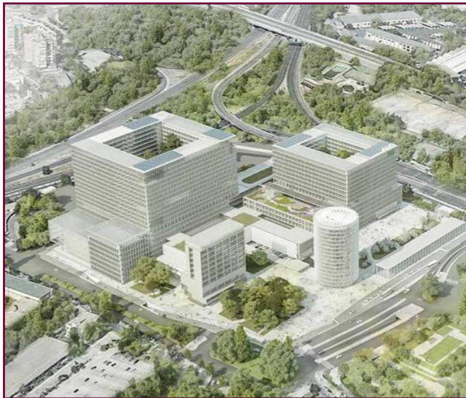
Maqueta del futuro hospital La Paz.

La importancia otorgada a la dedicación plena al hospital y a su estructura jerarquizada departamental en el hospital, y su evolución posterior hacia los servicios