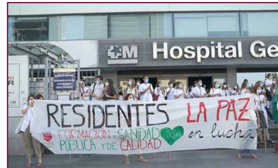
El MIR del siglo XXI.

y como un conjunto indisoluble con el resto de lo comentado hasta ahora, la incorporación a los hospitales públicos, de nuevas Universidades como la Autónoma de Madrid.