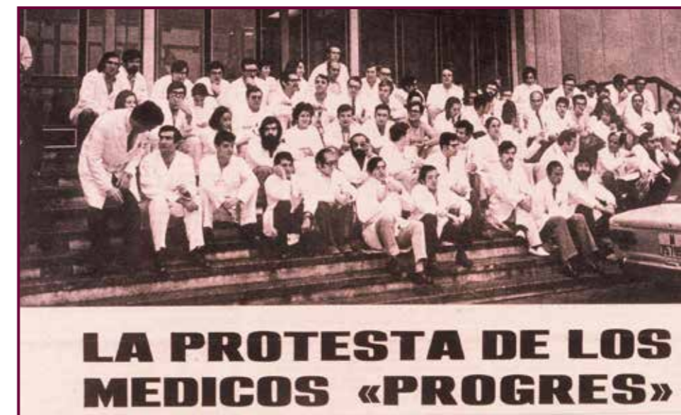
El MIR de los años setenta del siglo XX.