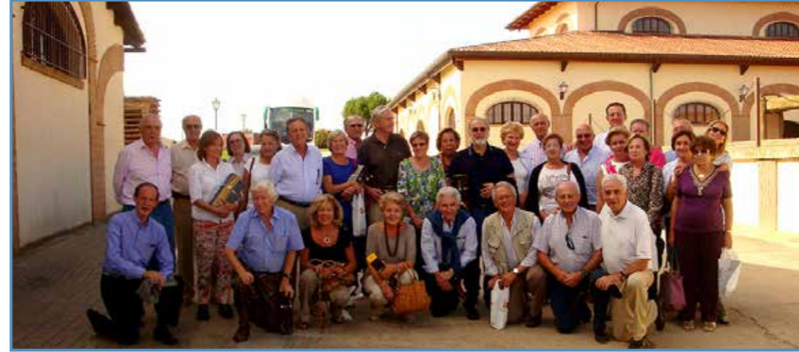
En Zamora 2012.

Ahora tenemos más tiempo para viajar a nuestra casa de descanso en Marbella, paraíso de relax, paseos, golf y amigos con los que compartimos muy buenos momentos, como son los partidos de golf con el Dr.