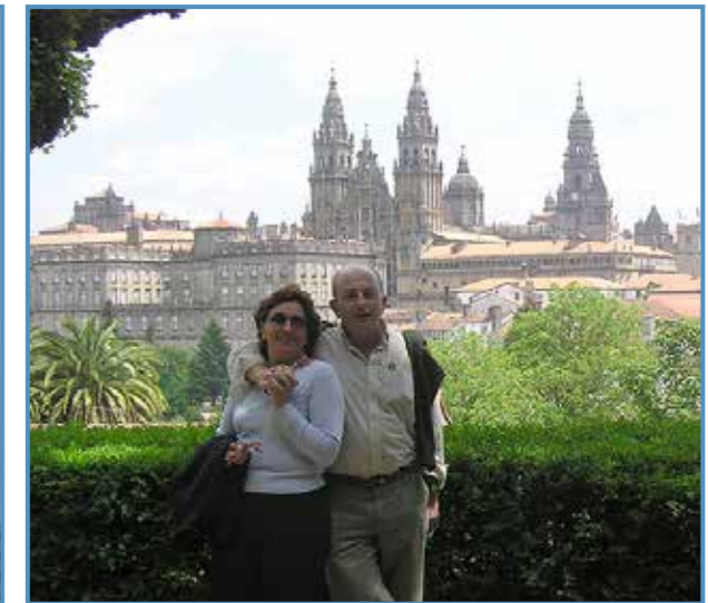
En Santiago de compostela con su esposa.