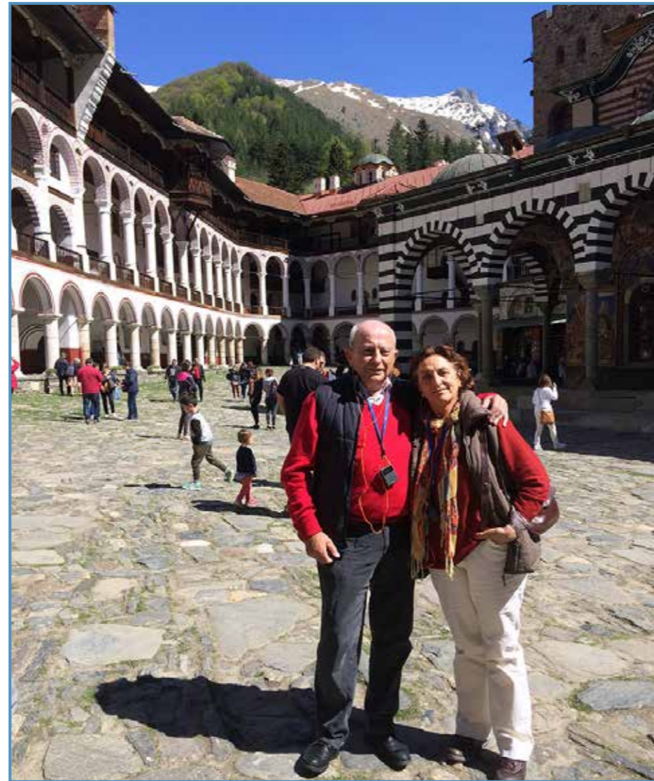
En el monasterio de Rila, Bulgaria.