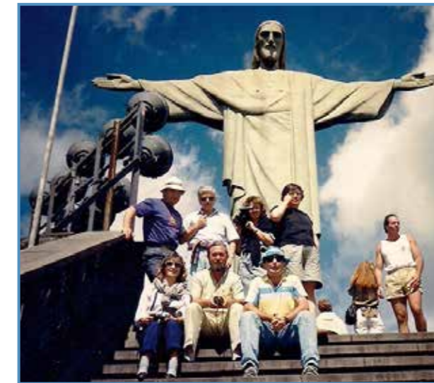
Grupo de amigos en Rio de Janeiro.