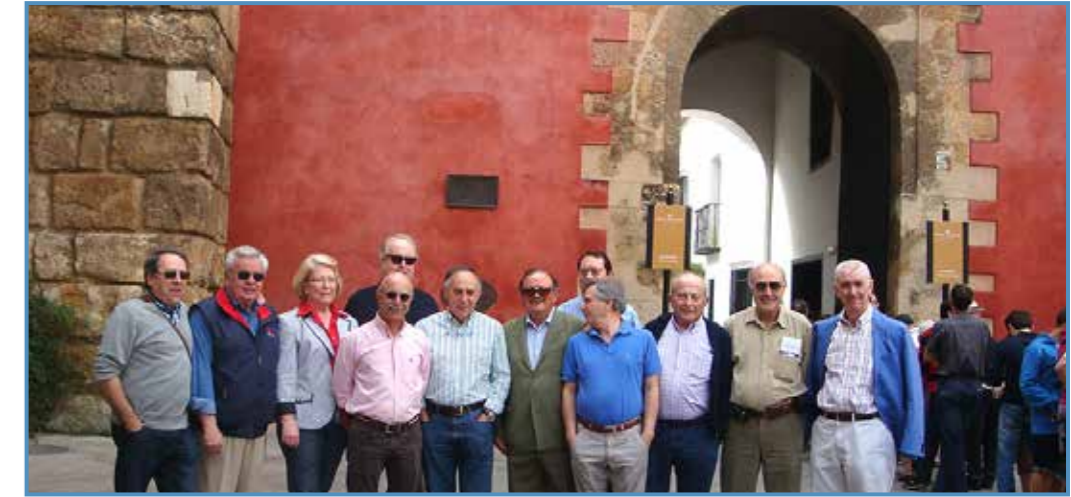
En Sevilla, Estomatólogos 2013.