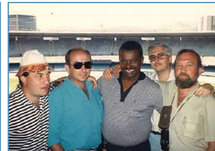
En el estadio Maracana.