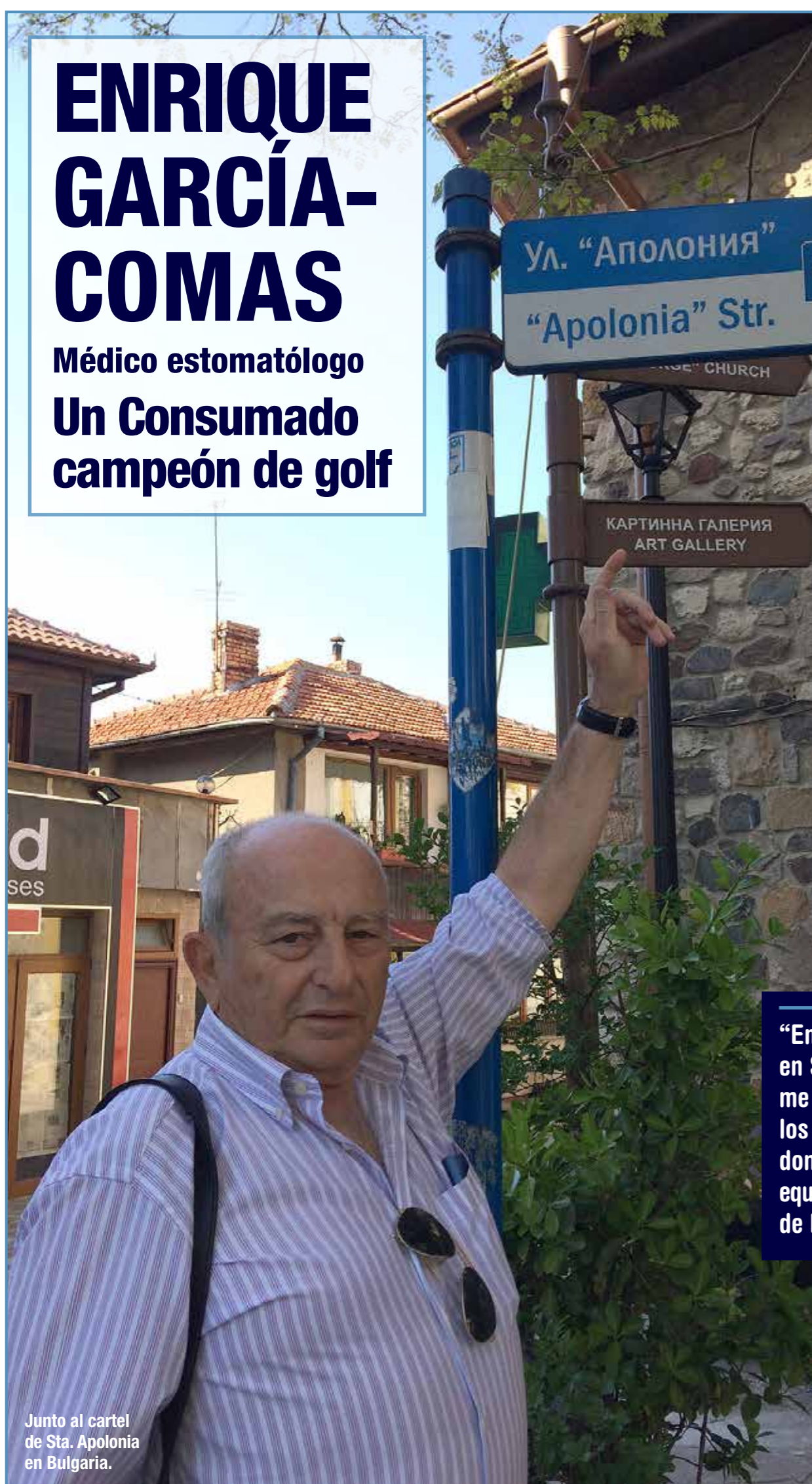
Junto al cartel de Sta. Apolonia en Bulgaria.

Médico estomatólogo Un Consumado campeón de golf