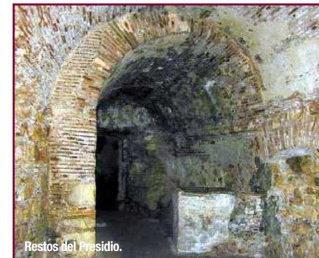
Restos del Presidio.