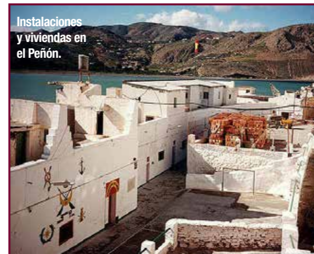
Instalaciones y viviendas en el Peñón.