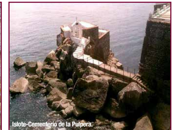
Islote-Cementerio de la Pulpera.