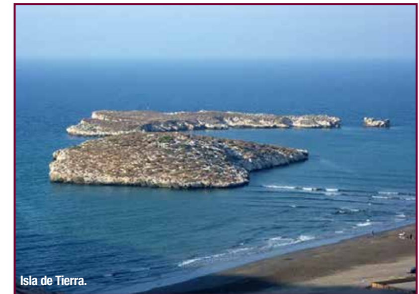
Isla de Tierra.