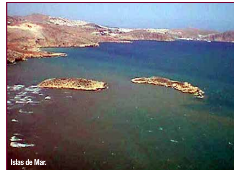
Islas de Mar.