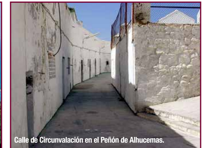
Calle de Circunvalación en el Peñón de Alhucemas.