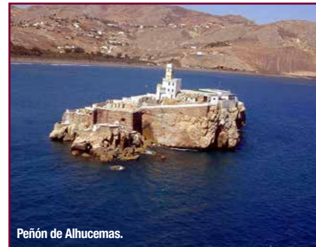
Peñón de Alhucemas.