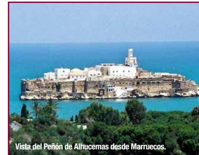
Vista del Peñón de Alhucemas desde Marruecos.