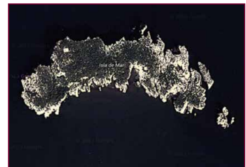
Isla de Mar.