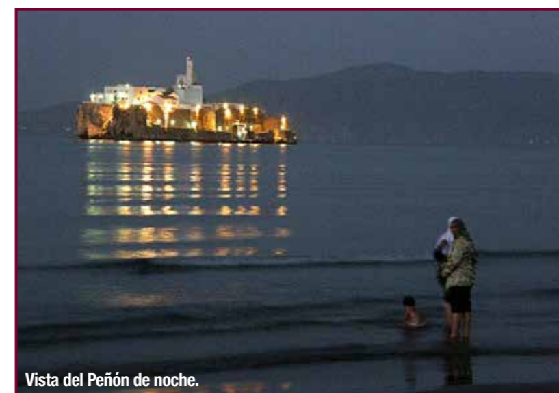
Vista del Peñón de noche.