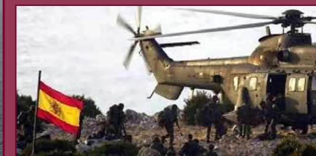
Desembarco español en la isla.