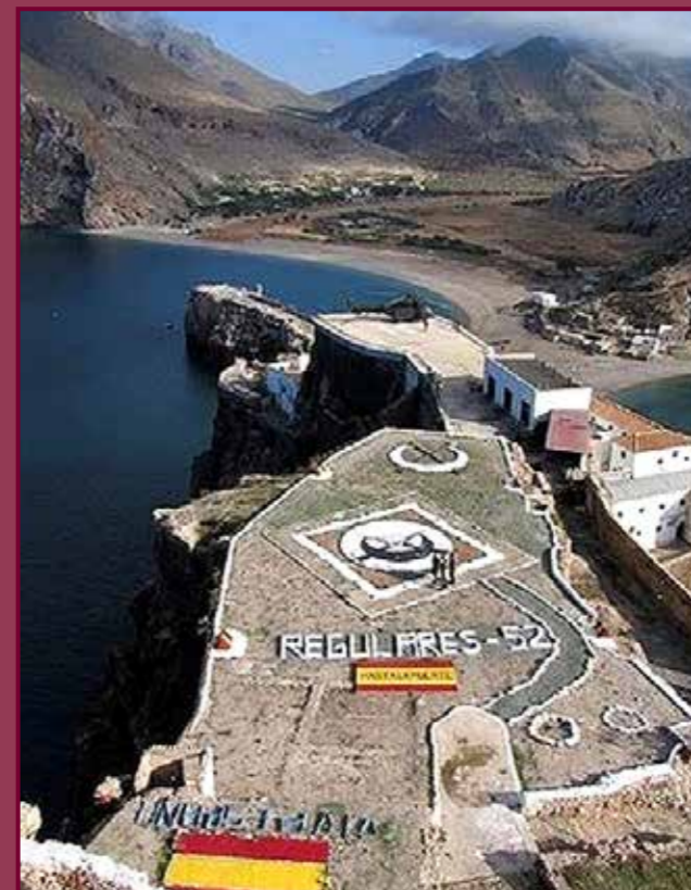
Vista aérea del peñón.