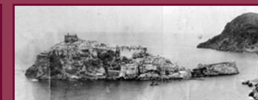
Vista del peñón en 1920 cuando aún era una isla.