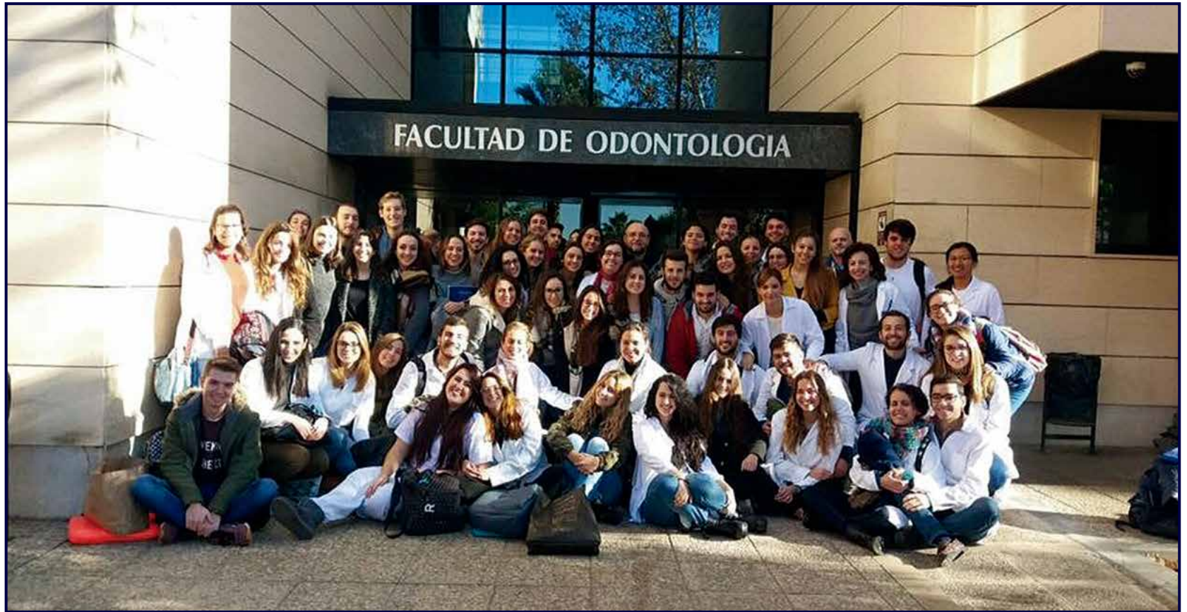
Con sus compañeros de promoción en la puerta de la Facultad de Sevilla.