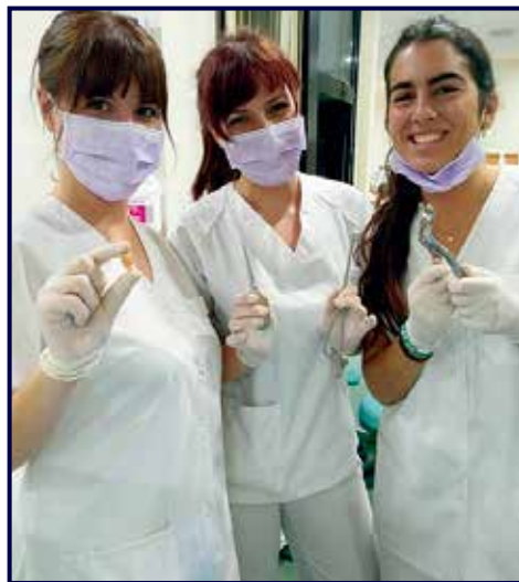
Con compañeras de curso.