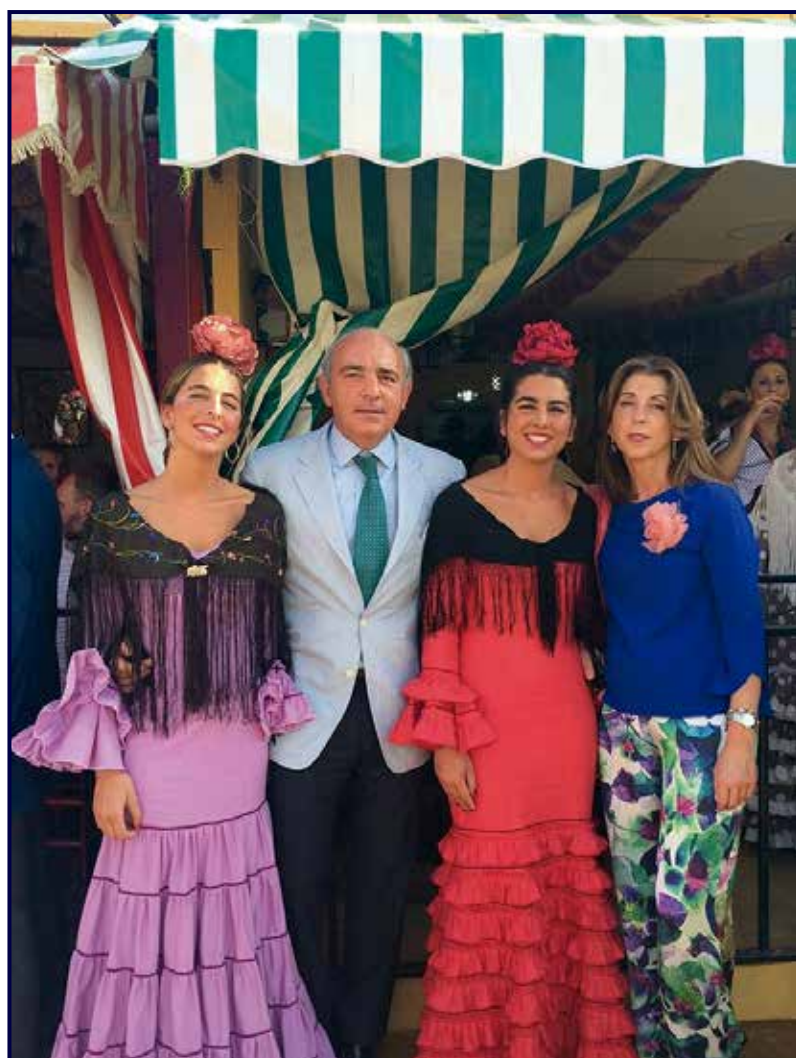
Con sus padres y hermana en la Feria de Sevilla.