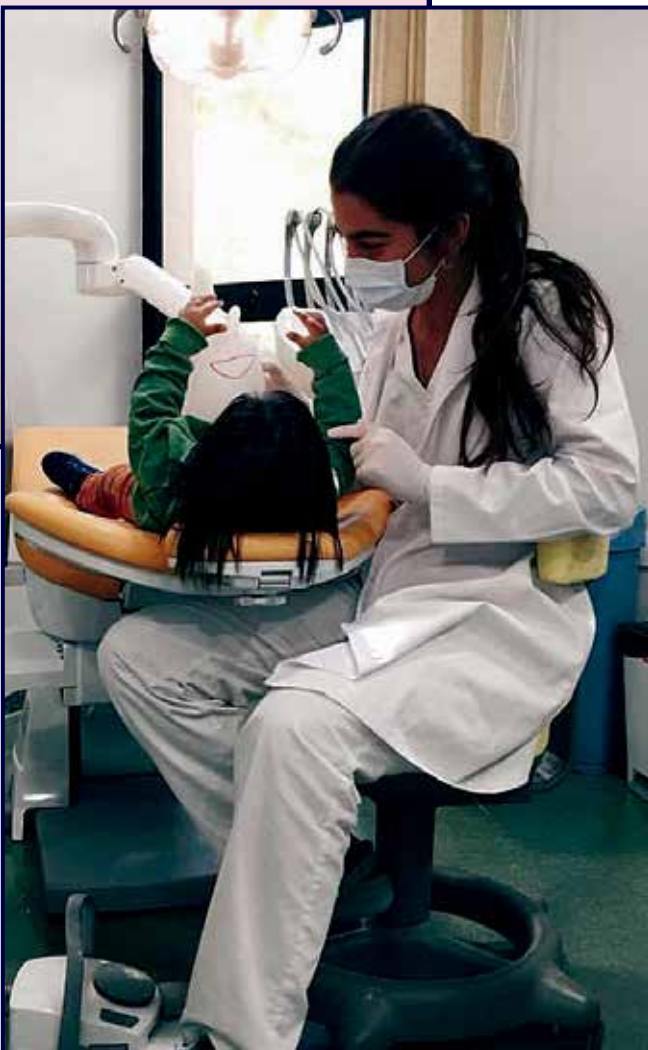
En la clínica atendiendo a una paciente.

P.- Por tus notas debes de dedicar muchas horas al estudio, pero cuando no estas estudiando... ¿cómo te evades?, ¿haces algún deporte?.