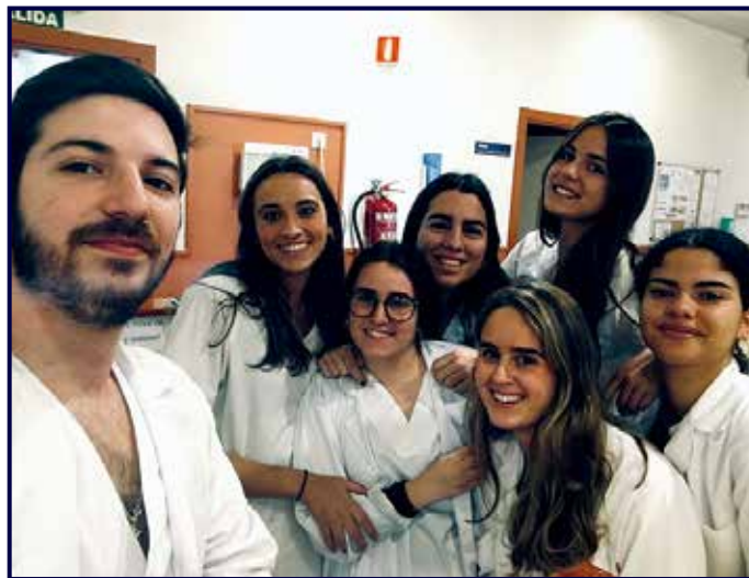
Rodeada de compañeros de estudios.