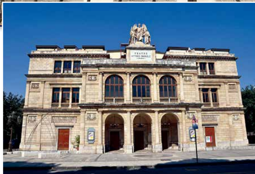
Arriba, iglesia de la Anunciación de los Catalanes. Teatro Vittorio Emanuele.

de mármol policromo y los sepulcros de Corrado IV y Alfonso I. El campanario se levanta a la izquierda de la catedral. Está formado por una torre adornada con un magnífico reloj monumental de cuatro cuadrantes en las cuatro caras de la torre. En la cara sur dos esferas marcan el calendario, el sistema planetario y un globo con las fases lunares; en la cara oeste dos huecos encierran un ingenio de dos autómatas que representan a Dina y Clarenza que durante las vísperas sicilianas dieron la voz de alarma, tocando las