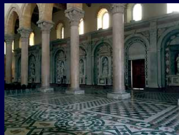
Arriba, reloj astronómico. Sobre estas líneas, interior de la Catedral de Messina.

La batalla de Lepanto está unida a la historia de la ciudad ya que los barcos cristianos que ganaron la batalla de Lepanto en 1571 se quedaron un tiempo en Messina