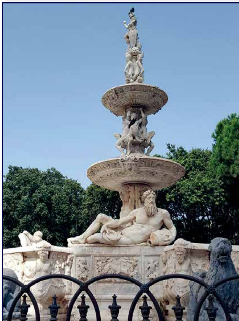
Arriba, estatua de don Juan de Austria. Sobre estas líneas, la fuente de Orion.