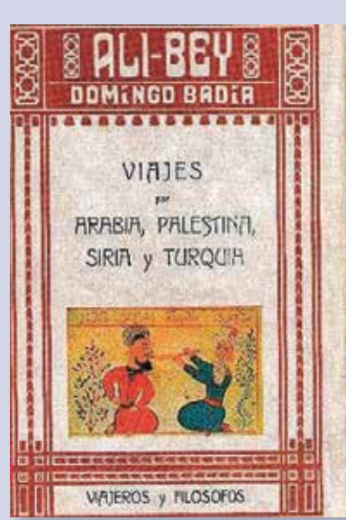
Portada del libro de viajes.

La vida de Domingo Badía pertenece al género literario de viajes y de aventura, tan de moda durante el siglo XIX, pero fueron otros personajes y relatos los que se llevaron la fama por hechos quizá de menor relieve que las peripecias de don Domingo. Su biografía daría para una superproducción, serie televisiva o documental si hubiera nacido en otro país occidental, pero a nuestros aventureros y exploradores muchas veces se les denigra y como casi siempre se les arrumba en el zaquizamí de nuestra memoria.