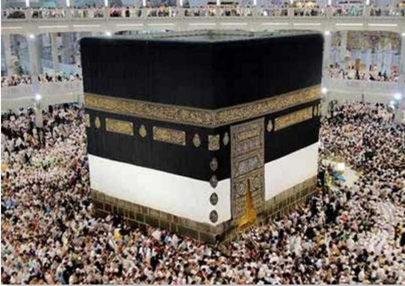
Domingo Badía se convirtió en el primer occidental que besó la Piedra Negra de la Kaaba, símbolo sagrado del Islam.