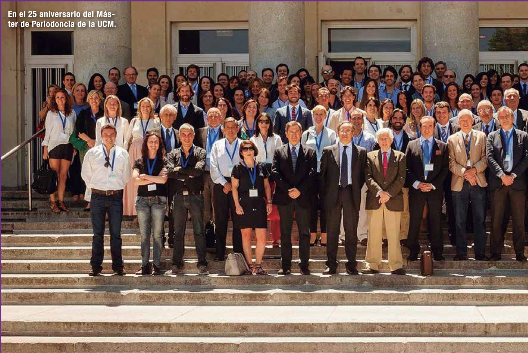
En el 25 aniversario del Máster de Periodoncia de la UCM.