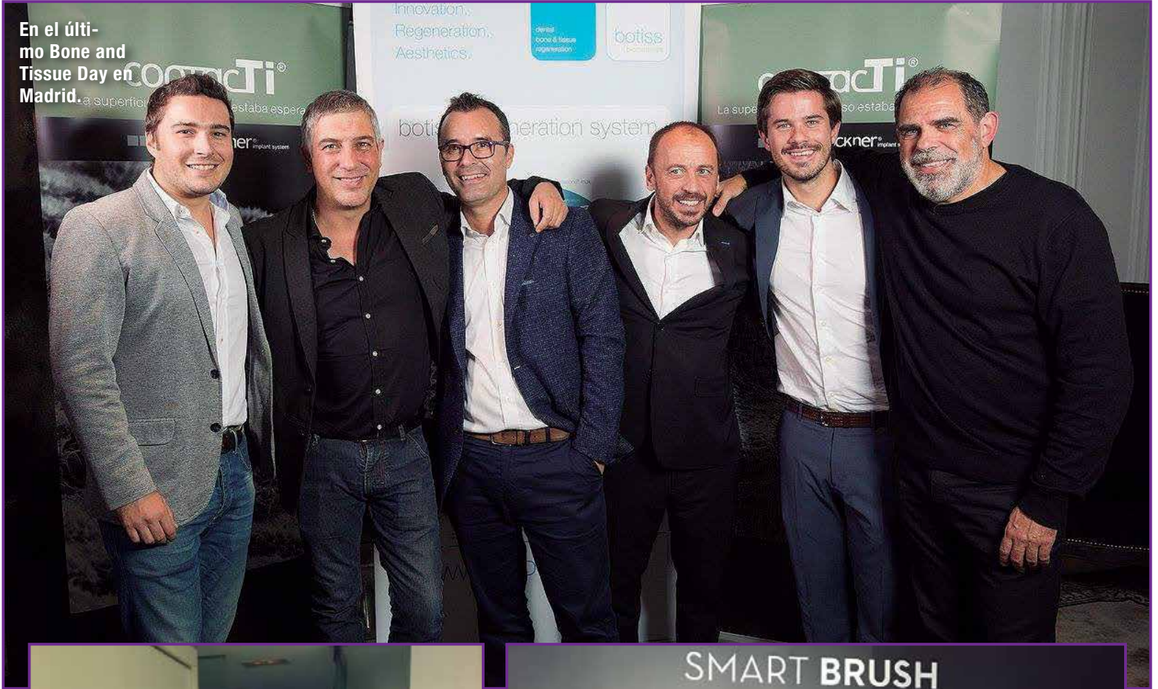
En el último Bone and Tissue Day en Madrid.