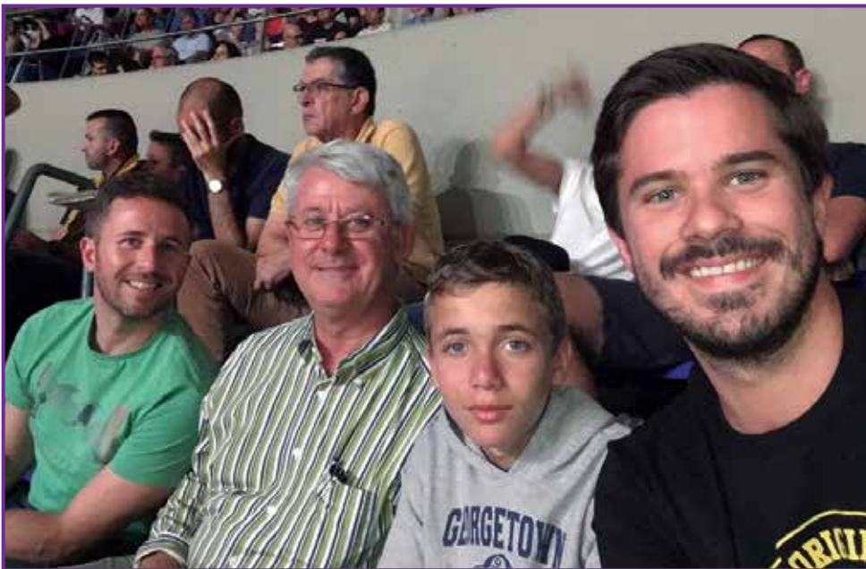
En la Final Four de la Basketball European League en Tenerife.

“Me gustaría seguir aprendiendo, y seguir avanzando en el mundo de la Periodoncia, y colaborando con el máster, al que tengo gran cariño tras estos 3 años”